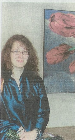
Ölgemälde stellt Elisabeth Weckes im Wesseling Schwingelerhof bis zum 24. Mai aus.

Mit farbenprächtigen, längst nicht nur frohen Ölbildern von Elisabeth Weckes beteiligte sich der Kunstverein Wesseling im Schwingelerhof an der Aktion und eröffnete damit zugleich das jährlich stattfindende, gut besuchte Frühlingstfest.